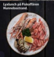
Lyxlunch på Fiskaffären Hunnebostrand.