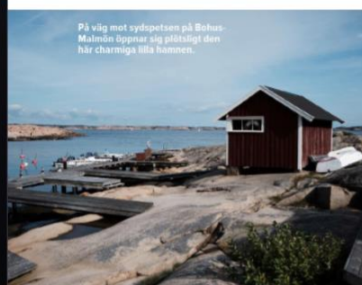
På väg mot sydspetsen på Bohus-Malmön öppnar sig plötsligt den här charmiga lilla hamnen.