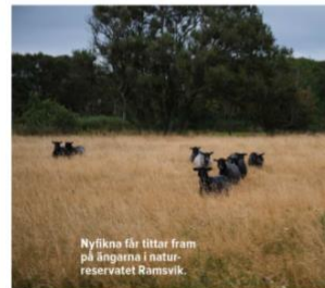
Nyläkna får tittar fram på ångarna i naturreservatet Ramsvik.

– Det är skönt att vara på sjön. Havet är verkligen en stor del av naturupplevelsen. Och det finns ju mängder med nya vandringsleder som bara väntar på att nås med hjälp av båt. ■