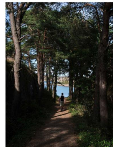
Meditativ pelarsal av tallar på väg ner mot favoritstranden på Bohus-Malmön.

Smått magiskt känns det vid de naturligt formade havsbänckarna Pärlane på Bohus-Malmön.