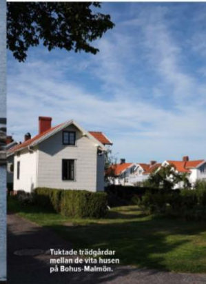
Tuktade trädgårdar mellan de vita husen på Bohus-Malmön.

Det har blivit tidig söndagsmorgon och efter en frukost på glasverandan dunkar nu motorbåten mot Hällö allra längst ut i havsbandet. Här kan man checka in på vandrarhemmet nästan året runt och möta naturen i dess mest meditativa form.