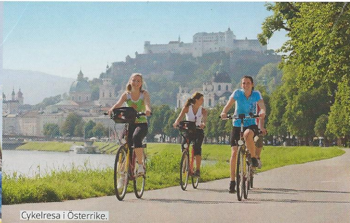
Cykelresa i Österrike.